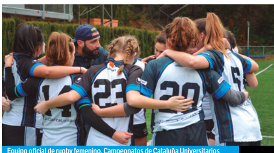
Equipo oficial de rugby femenino. Campeonatos de Cataluña Universitarios