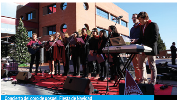
Concierto del coro de gospel. Fiesta de Navidad

En UIC Barcelona promovemos y organizamos actividades deportivas y competiciones, y facilitamos descuentos y condiciones ventajosas para acceder a instalaciones deportivas para que te mantengas en forma y vivas de manera saludable. Durante el curso, organizamos actividades solidarias con múltiples instituciones y te asesoramos para que hagas voluntariado. Podrás participar de manera activa en el #UICSocialDay , un día en el que toda la Universidad se vuelca para ayudar a los más necesitados. También podrás formar parte de grupos de teatro, debate, pintura y música, que potencian la vertiente cultural de UIC Barcelona y te ayudan a adquirir más competencias y valores.