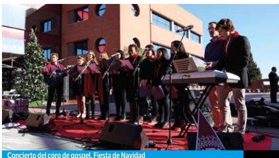
Concierto del coro de gospel. Fiesta de Navidad

En UIC Barcelona promovemos y organizamos actividades deportivas y competiciones, y facilitamos descuentos y condiciones ventajosas para acceder a instalaciones deportivas para que te mantengas en forma y vivas de manera saludable. Durante el curso, organizamos actividades solidarias con múltiples instituciones y te asesoramos para que hagas voluntariado. Podrás participar de manera activa en el #UICSocialDay , un día en el que toda la Universidad se vuelca para ayudar a los más necesitados. También podrás formar parte de grupos de teatro, debate, pintura y música, que potencian la vertiente cultural de UIC Barcelona y te ayudan a adquirir más competencias y valores.