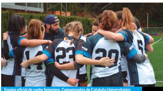
Equipo oficial de rugby femenino. Campeonatos de Cataluña Universitarios